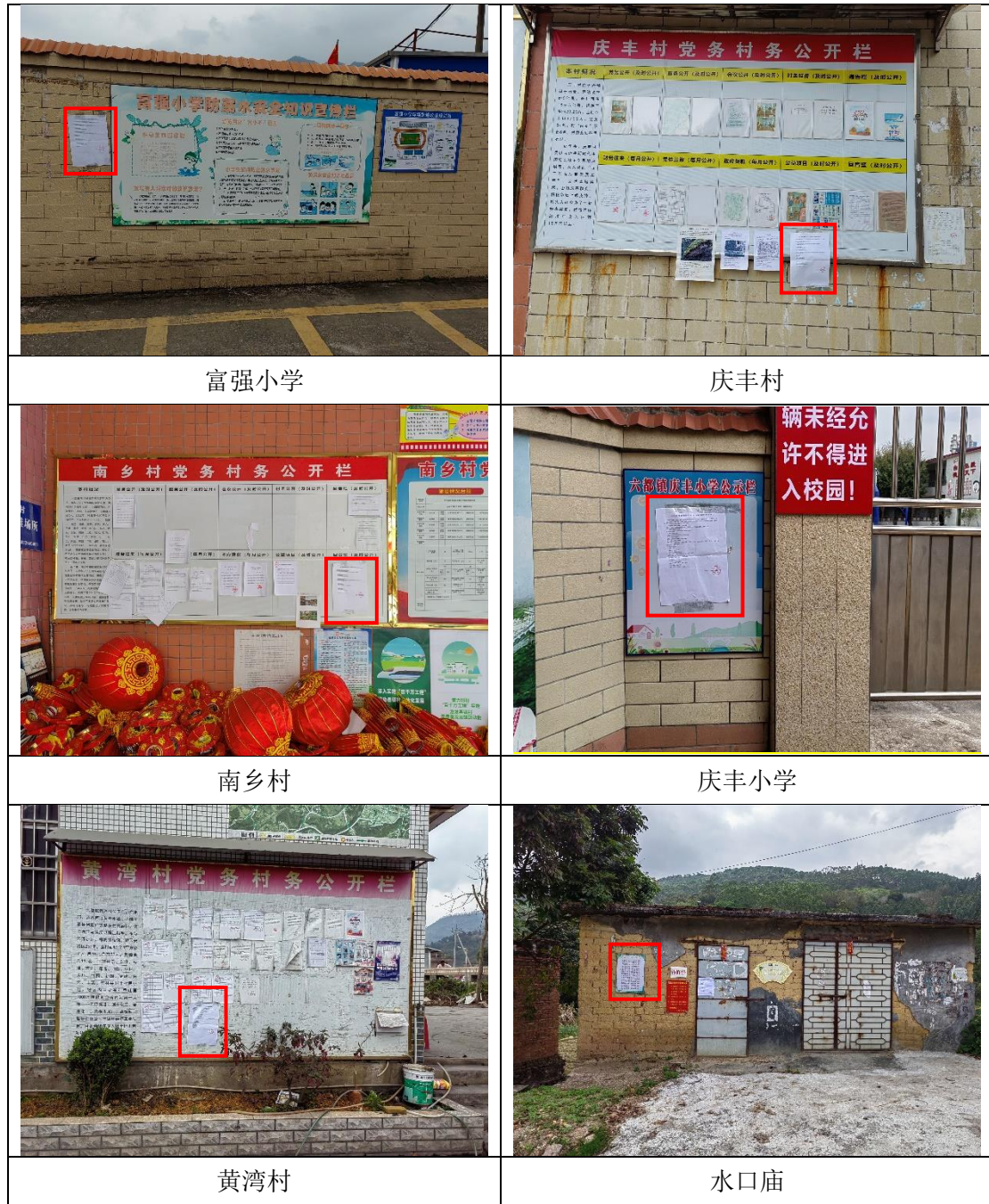
图 3.1-4 本项目征求意见稿环境影响评价信息张贴公示照片