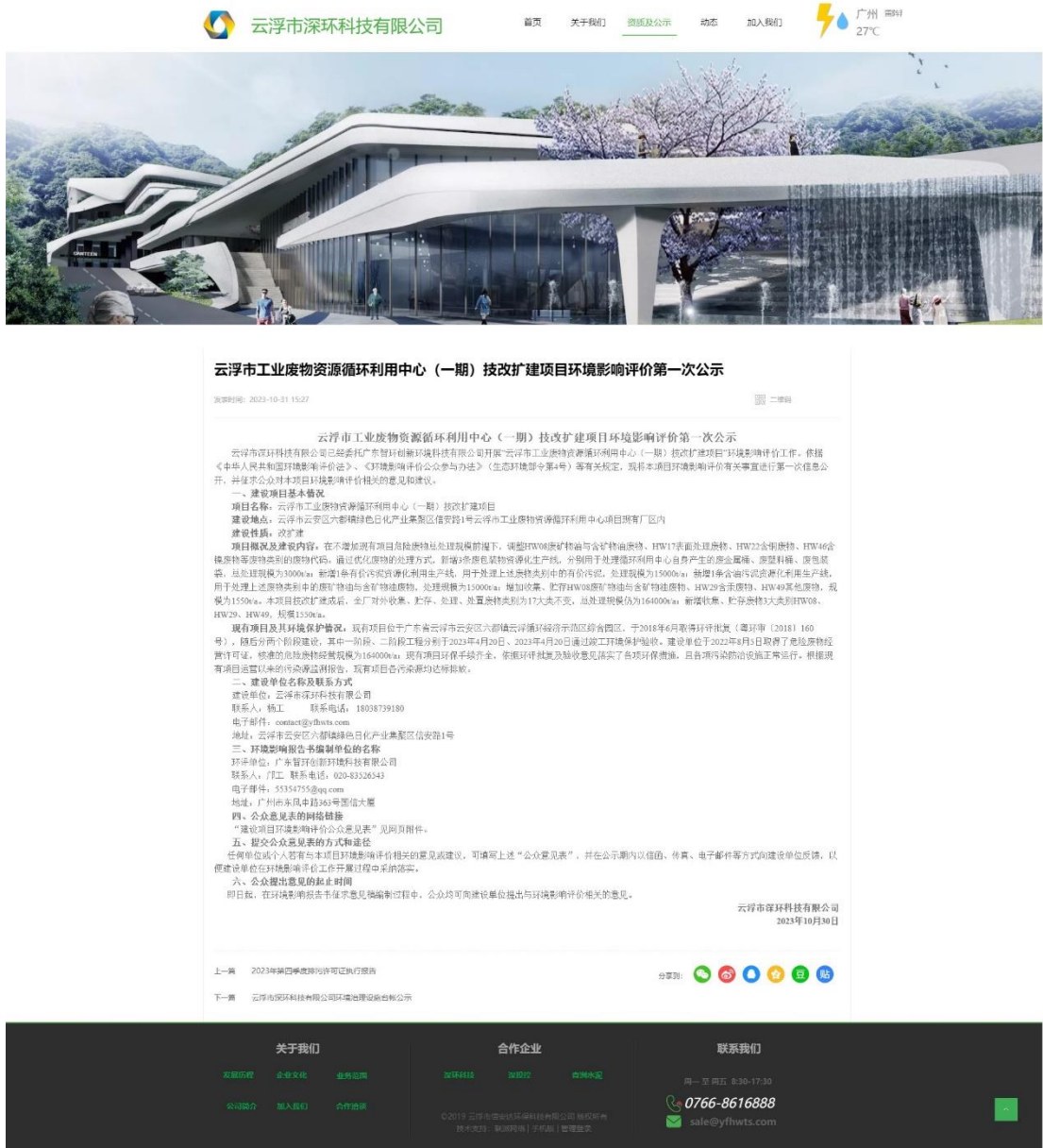
图 2.1-1 本项目首次环境影响评价信息公示截图